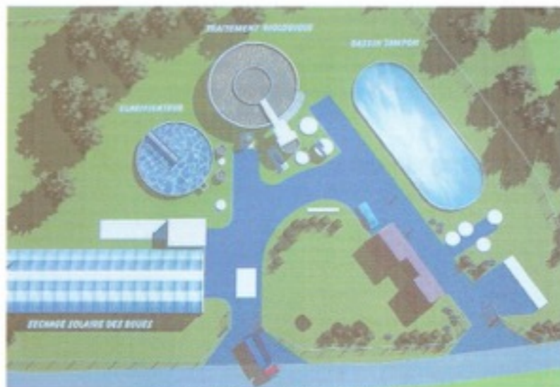
Plan de la future station d'épuration

Le 14 novembre dernier a eu lieu la pose de la première pierre de la station d'épuration de la commune. Cette cérémonie