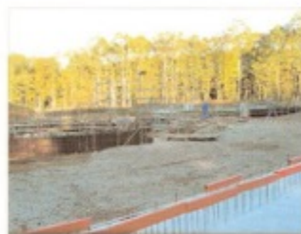
Les travaux d'implantation

Parmi les différentes étapes du traitement, plusieurs procédés novateurs seront mis en place. Il s'agit notamment du traitement des boues par séchage sous serre. Cette technique permet, après déshydratation, de sécher les boues par voie naturelle et de stocker la production d'une année. La station sera également équipée d'une filière de traitement pour les matières de vidange et pourra ainsi recevoir les matières issues des dispositifs d'assainissement non collectif.