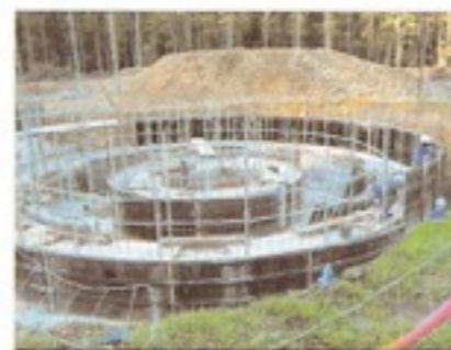
Coffrage des bassins

Afin de satisfaire au maximum les exigences en matière de qualité environnementale, la