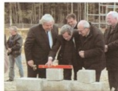
Une station qui sera bien de niveau

communauté de communes, «La Porte Normande», maître d'ouvrage et la Compagnie Générale des eaux, entreprise assurant l'exploitation de la station, se sont engagées pour la mise en place d'une certification ISO 14 001.