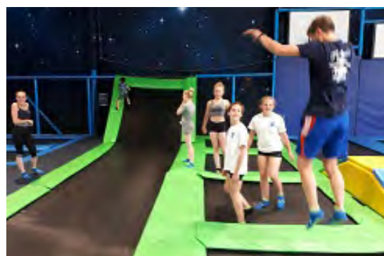
Stage prof-encadrant à Evreux