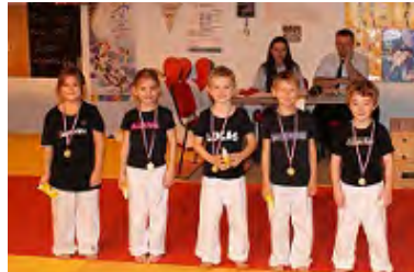
FC Podium Kikido