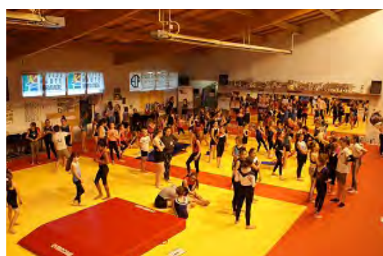
Anim 27 acces gym GRS