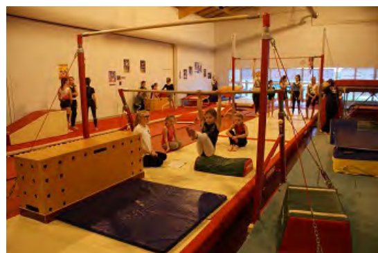
Animation départ. Sur agrès

Contact Coordinateur : Isabelle Bacon Tél. 06 81 42 04 75 - http://alliance27judo.gym.free.fr