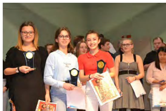
Trophée juges gym