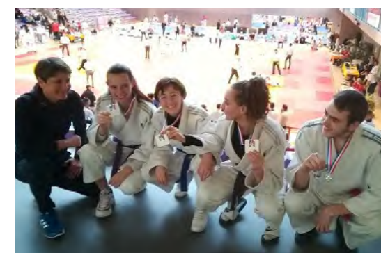
2e fois champions de France Jujitsu