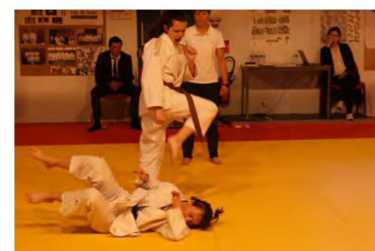
Tournoi de l'Eure de Jujitsu