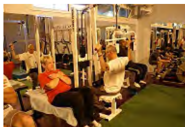
Muscul externe + 18ans