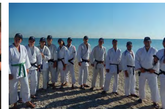
Stage Judo en Italie pour 13 élèves (1 semaine)