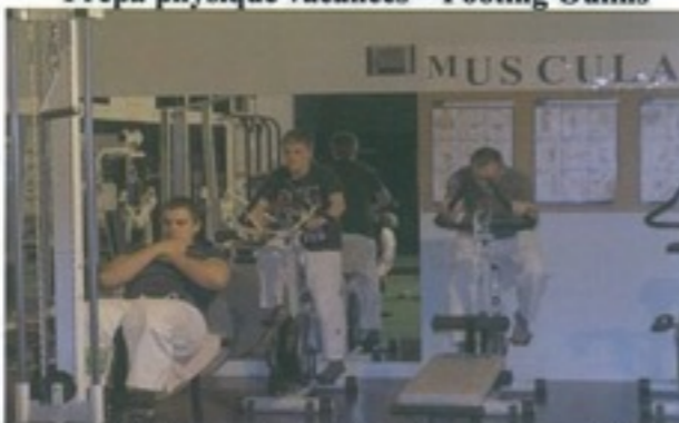
Entrainement musculation pour nos élites