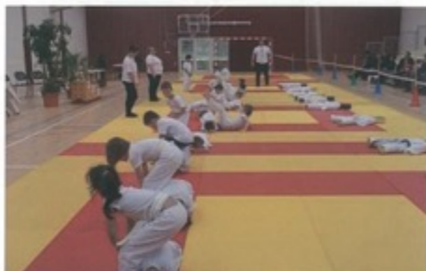
Démonstration classe kikido enfants 5-6 ans