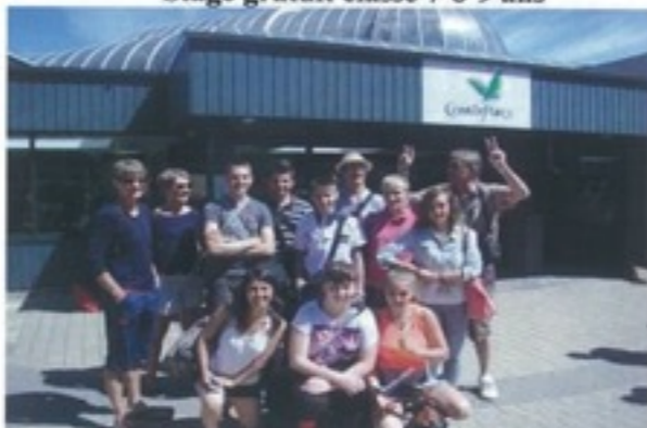
Sortie loisirs encadrement classe 12-13 ans