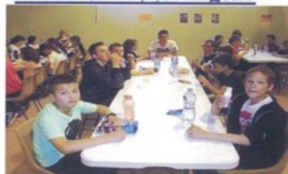
Stage gratuit classe 10-11 ans