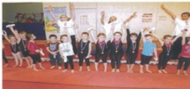
Porte ouverte Noël classe enfant 5-6 ans