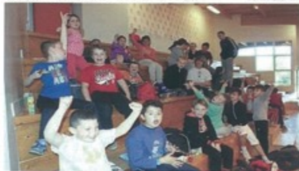
Stage gratuit classe 7-8-9 ans