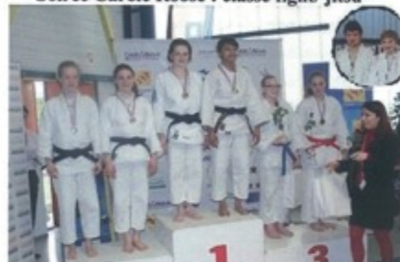
4 Médailles de bronze au championnat de France

9 Stages d'1 semaine en Italie offerts par le club