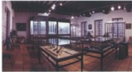
Vue du musée

L'année 2015 a été riche en événements. Le musée vous a proposé près de soixante animations pour les petits et grands ! Les ateliers pour enfants programmés pendant les quatre périodes de vacances scolaires 2015 ont permis de sensibiliser plus de 130 enfants au patrimoine local. L'étroite collaboration entre le musée et la Conservation départementale du patrimoine de l'Eure a permis à de nombreux habitants de la région de (re)découvrir les traces laissées par les facteurs d'instruments à La Couture-Boussey mais aussi aux alentours.