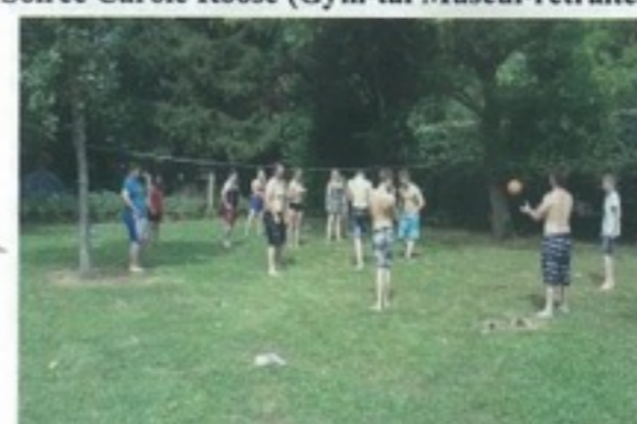
Loisirs détente classe Muscul-Ext. & Int.