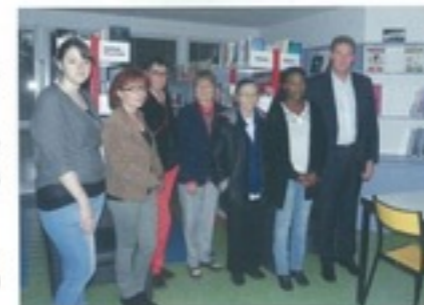
Inauguration de la bibliothèque en présence de Monsieur le Maire

Enfin, La bibliothèque propose depuis décembre des cd et dvd s'adressant autant aux enfants qu'aux adultes. Les collections seront alimentées par la médiathèque départementale de l'Eure 2 fois par an.