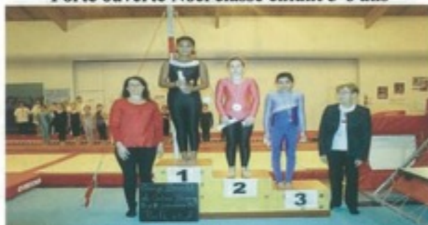
Passage de bracelet classe enfant 9-10 ans