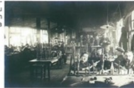
Atelier de facteurs d'instruments

Exposition présentée du 1 er février au 15 novembre 2016 Visites guidées de l'exposition les samedis à 14h30.