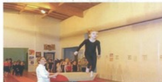
Stage départemental classe enfant 7-8 ans