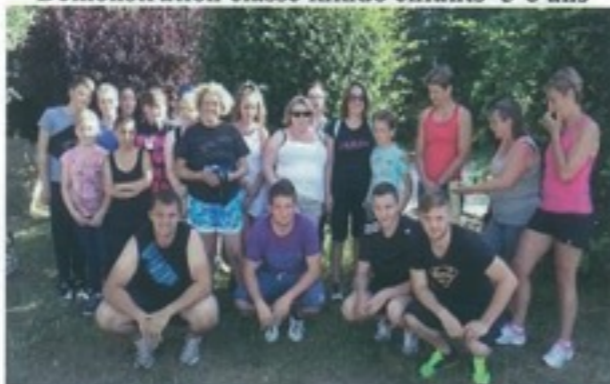
Prépa physique vacances – Footing Oulins