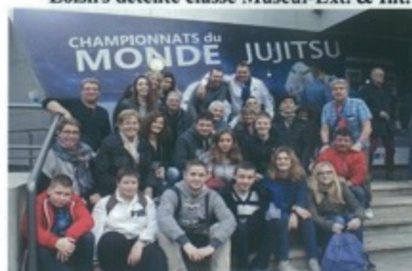
L'alliance à Paris Coubertin