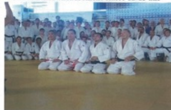
Classe judo Adulte

9 Stages d'1 semaine en Italie offerts par le club