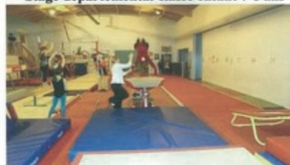
Stage de vacances classe 11-12 ans